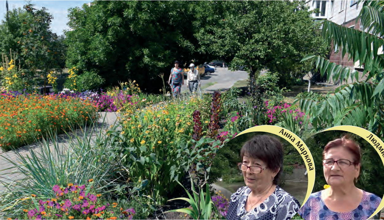
Пёстрые клумбы встречают прохожих