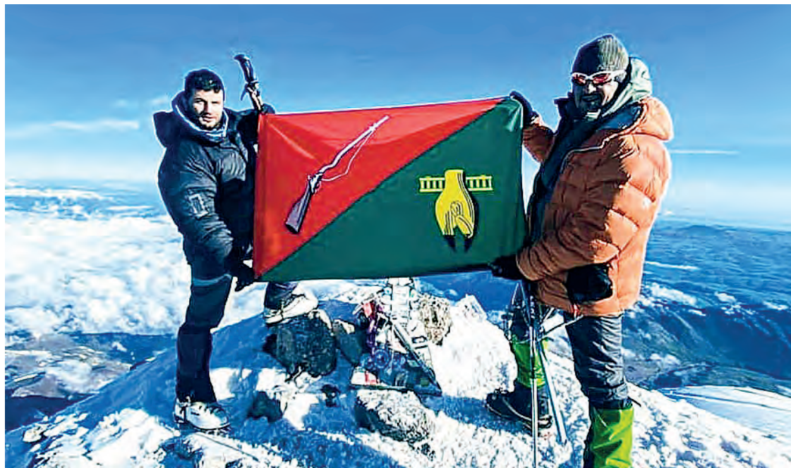
📷 Георгий и Максим – покорители горы

Старооскольцы подняли флаг нашего округа на вершину Эльбруса