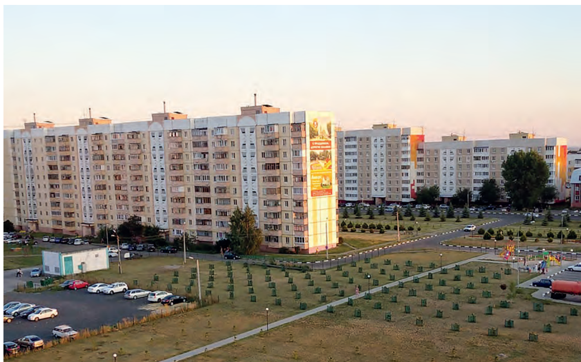
Строитель с высоты

Приезжающие в Строитель удивляются множеству коттеджей, ярким детсадам и... отсутствию маршруток