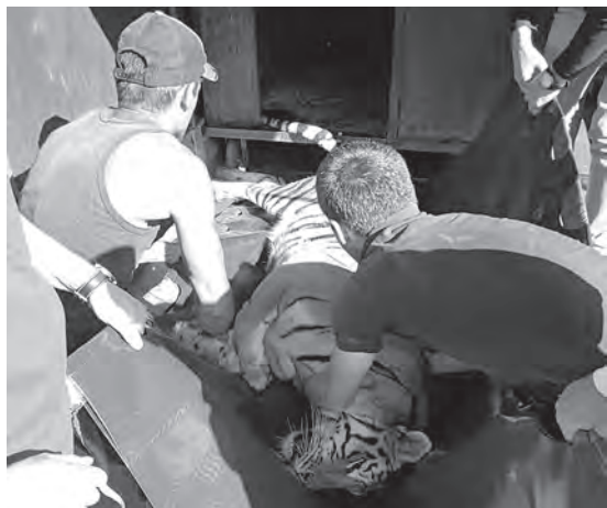
■ Сложная операция