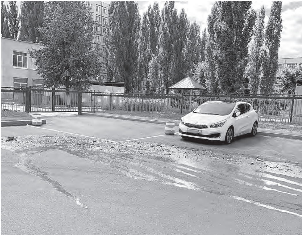
Иногда бывает и так...

Помидорно-арбузная жижа оседает не только в баках, но и на асфальте