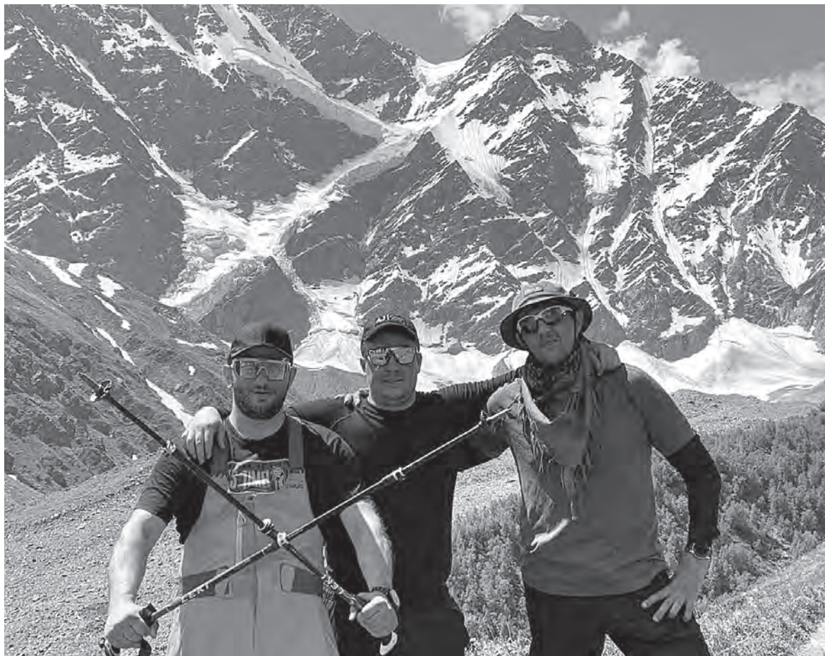
☑ Трое смелых

– В нашей группе было восемь человек – мы, парни из Тамбо-