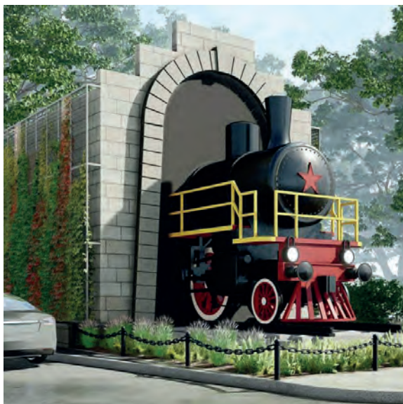
Паровоз останется на месте