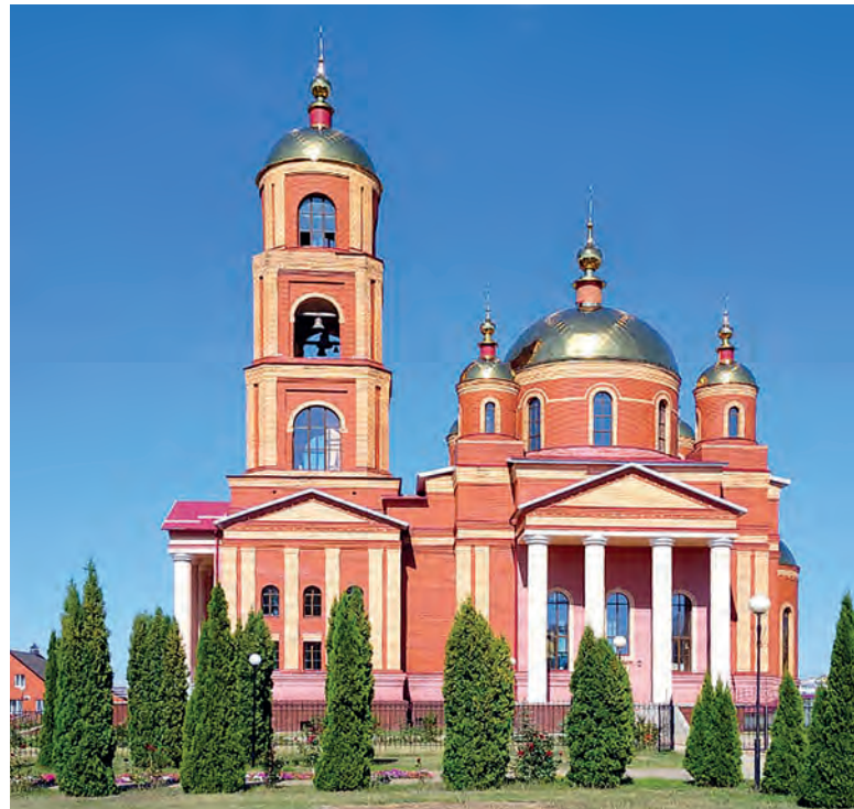
Главный храм Строителя