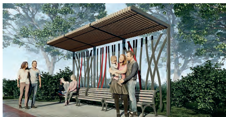
Лавочки для отдыха