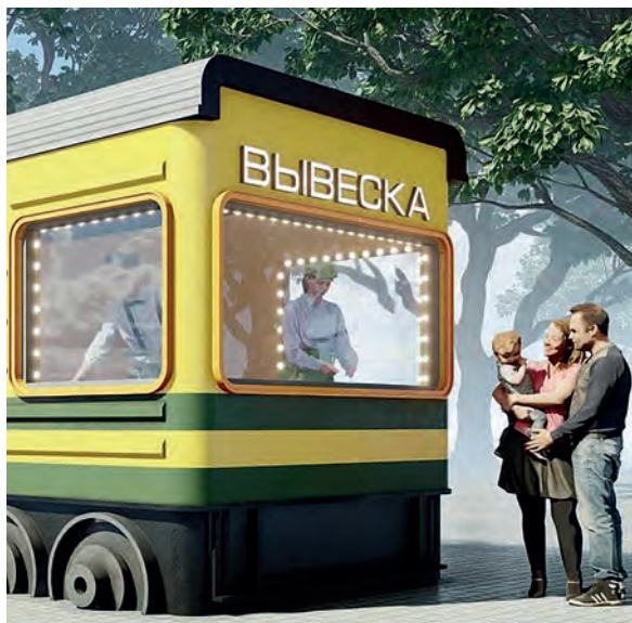
Будет место для торговли