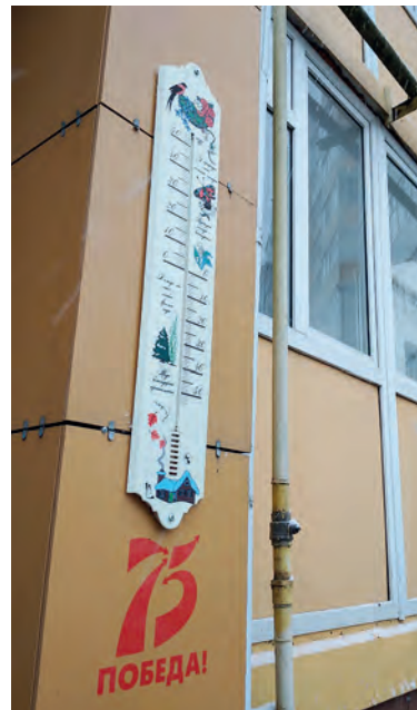
Дворы в Строителе управляющие компании украшают огромными градусниками

Но в общем и целом городок любопытный. Разок приехать можно. Однако жить там я бы не хотела: маловат будет.