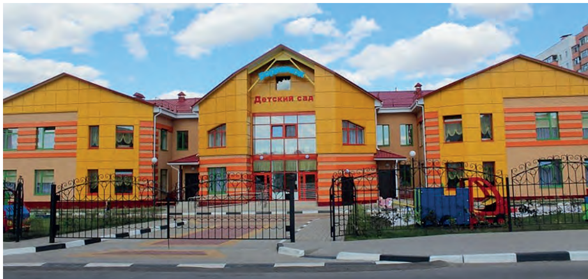
Вот такие в Строителе детские сады