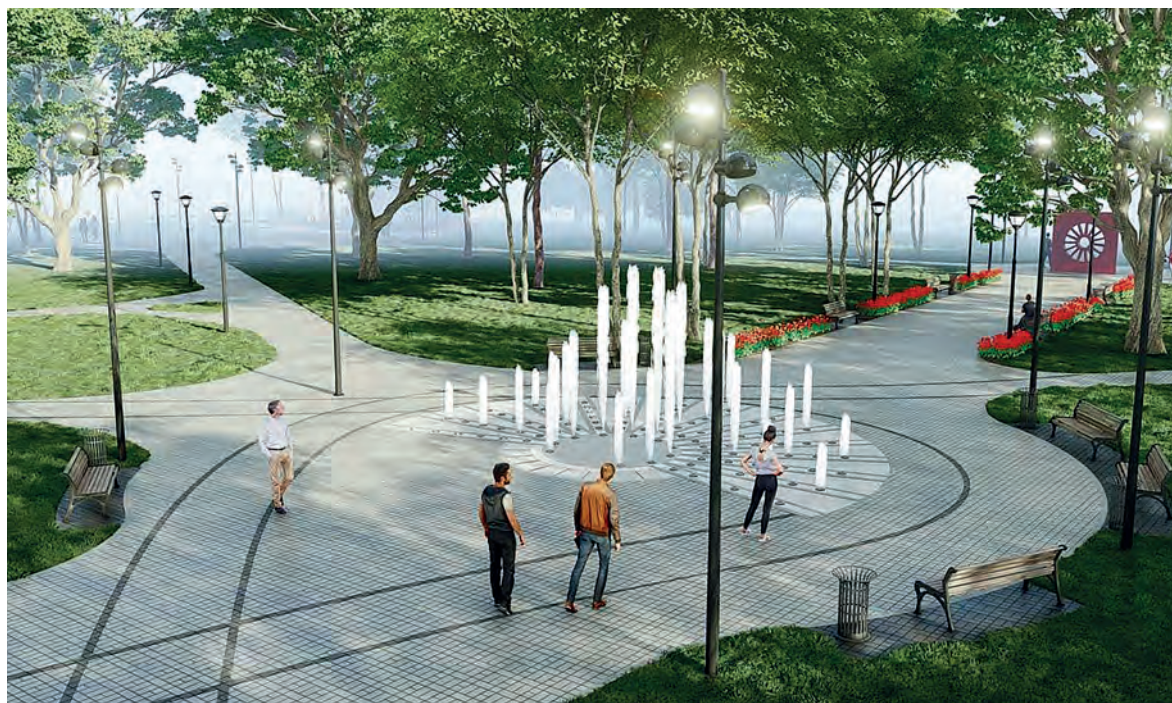
Центральная площадь