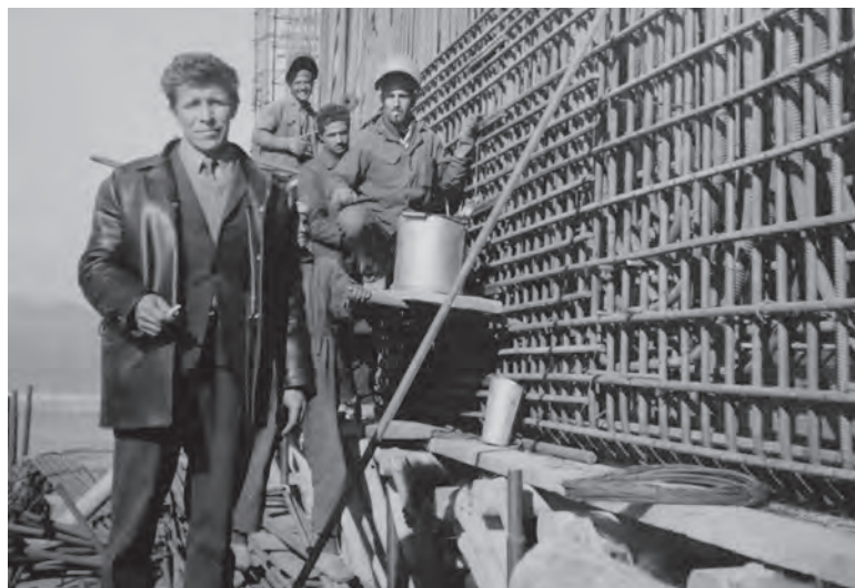
■ Командировка в Иран

На заслуженный отдых Владимир Константинович вышел в 2016 году. Он награждён орденом Трудового Красного Знамени, медалями «За освоение целинных земель», «За доблестный труд», «За трудовое отличие», «За заслуги перед Землёй Белгородской» II степени. Спасибо, Владимир Константинович, за ваш труд! Предприятия, которые вы строили, будут работать ещё долгие годы. Желаем и вам долгих лет жизни! Пусть вас радуют внуки и правнуки!