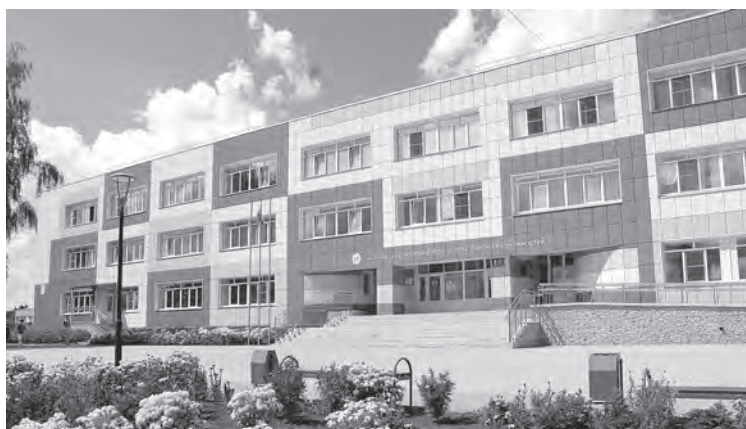
■ Школьная жизнь здесь будет яркой

В Монаковской школе трудятся 19 учителей. Среди них – немало бывших выпускников, как и в