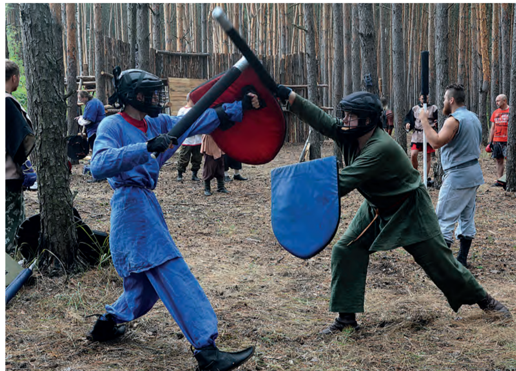
Участники клуба «Авалон»

В Старом Осколе впервые состоялись состязания по историческому фехтованию и средневековому бою