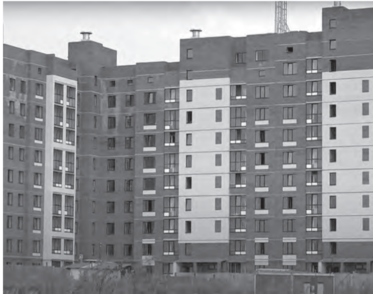
Дом для переселенцев

В апреле этого года областной департамент сообщил, что вы-