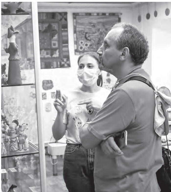
■ На экскурсии по городскому округу

Поскольку одной из задач пленэра является расширение культурных связей не только на уровне организаций, но и вовлечение в этот процесс жителей области, место проведения ежегодно меняется.