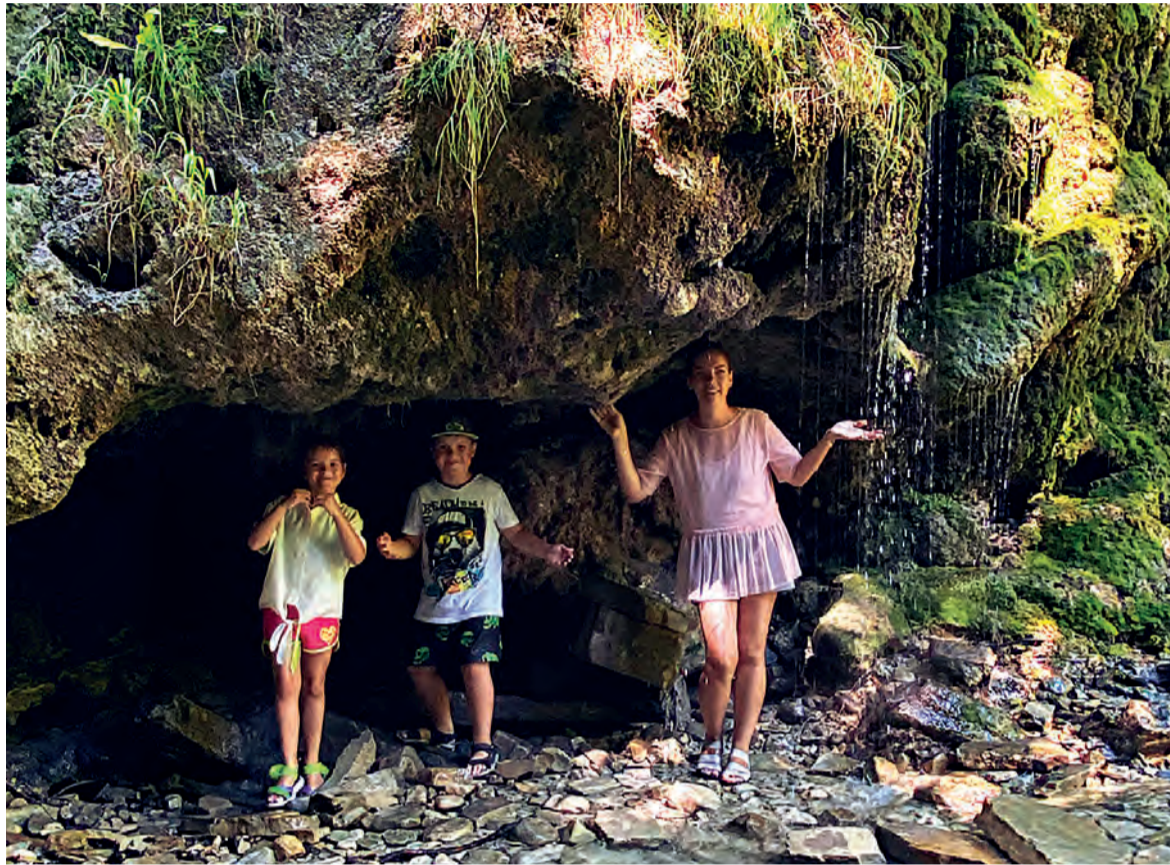
Витязево – популярное место отдыха у оскольчан

Курортные посёлки Анапы – в числе самых популярных мест летнего отдыха для миллионов россиян. Джемете, Витязево, Благовещенская, Сукко и Большой Утриш расположены недалеко от города, везде развита инфраструктура, песчаные пля-