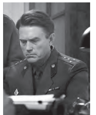
Кадр из трейлера фильма (Андрей Гусев)

В фильме «Дорогие товарищи!» описываются события 1962 года в Новочеркасске, где прошла забастовка на заводе, люди потребовали снизить цены на продукты и повысить зарплату. Когда к забастовке присоединились на других предприятиях, власти решили ввести в город армию.