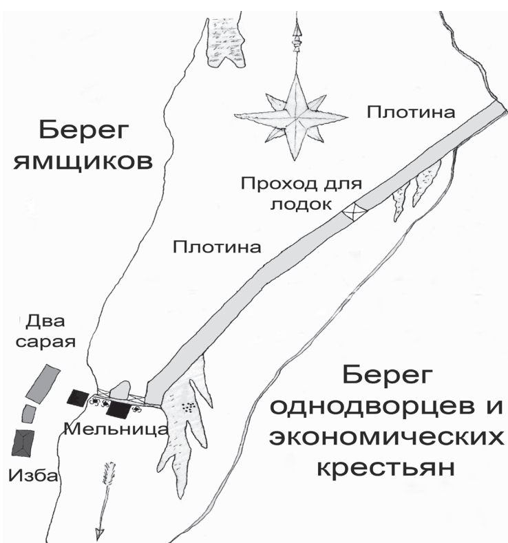
❷ План ладейской мельницы и плотины

7 августа 1801 года, в начале правления молодого императора Александра I, был подписан именной Указ, который предписывал все казённого ведомства мельницы в государстве, кем бы они ни были построены, передать мирским обществам без всякого в казну платежа, и исключить их из оброка. Исполняла данный Указ в центре Владимирская казённая палата, на местах – начальники губерний. Они объясняли, что мельницы должны иметь общее владение с двух сторон реки: с одного берега – кто строил, а с другого – по примыканию плотин.