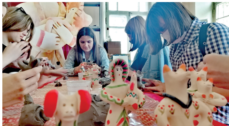
Занятие по глиняной игрушке

В его рамках обустраивают мастерские, где будут проводиться групповые и индивидуальные занятия мастеров с детьми и взрослыми по изготовлению старооскольской глиняной игрушки, традиционному гончарству, ло-