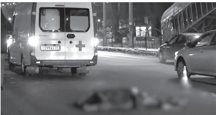
■ На месте аварии