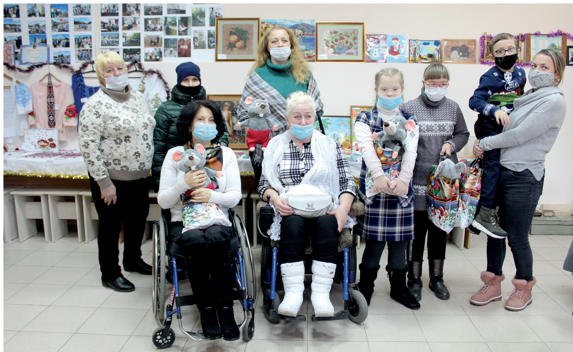
Авторам вручили подарки

Необычные работы на выставке в центре досуга общества инвалидов