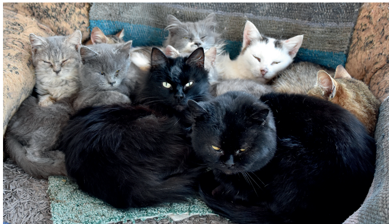
Домашние любимцы

чески под колёсами машин? Погибла бы, да и всё.