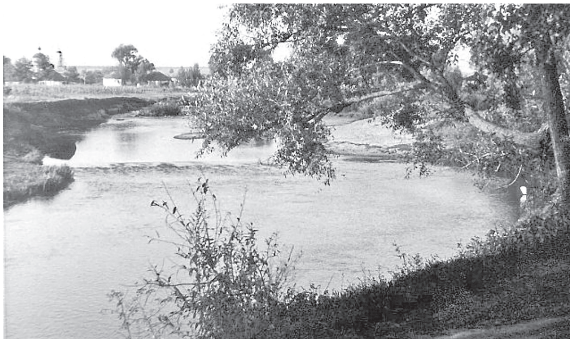
❶ Фото 1950 года, на котором при низком уровне воды хорошо просматриваются отмели и пороги того места, где стояли мельница и плотина