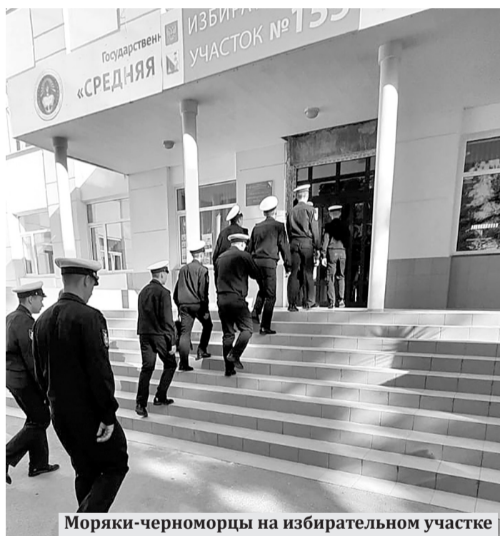
Моряки-черноморцы на избирательном участке

■ Материал подготовили Алексей Дёменко, Евгений Горожанкин, Юрий Теплов, Сергей Руссу, Светлана Пивоварова