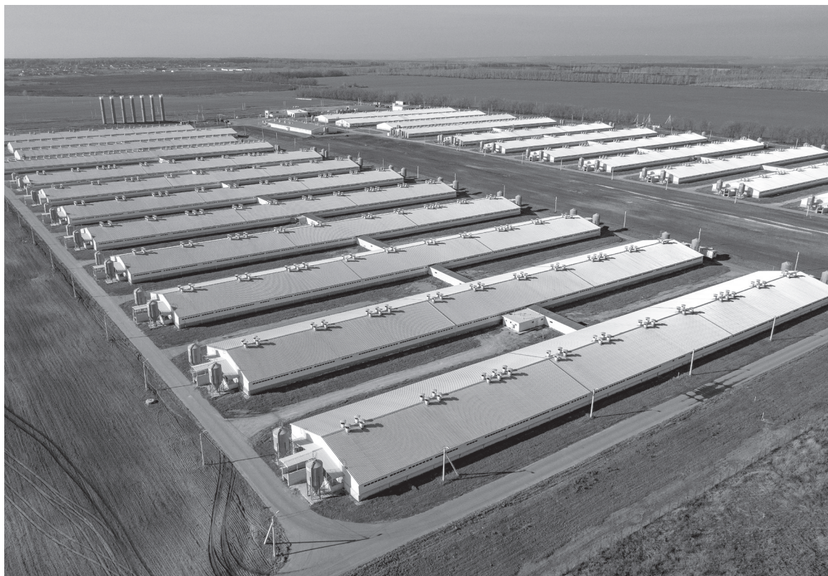
■ «Оскольский бекон – 3»

В последнее время специалисты компании работают по новой технологии внесения жидких органических удобрений на поля – сначала проводится сплошное рыхление почвы, только потом приступают к внесению. При этом с помощью высокоточного программного обеспечения ситуа-