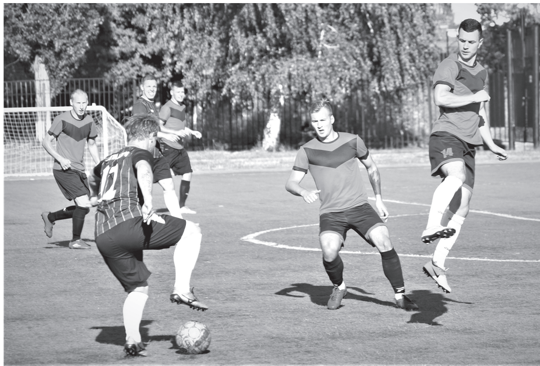
■ Играют «Металлург» и «Короча»

Во втором тайме металлурги добавили движения, но было поздно – мяч в воро-