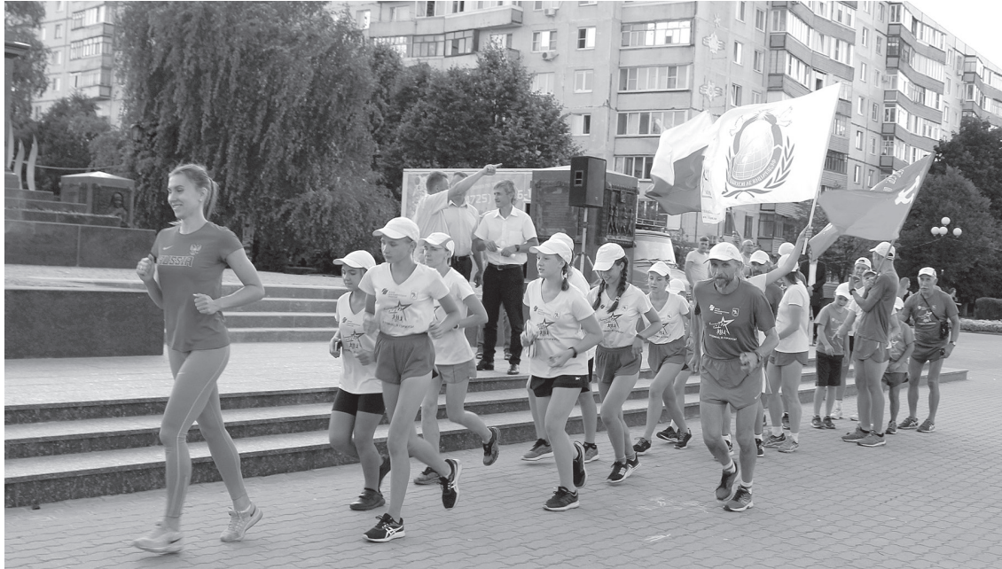
■ Марафон «Память и слава, 75!»