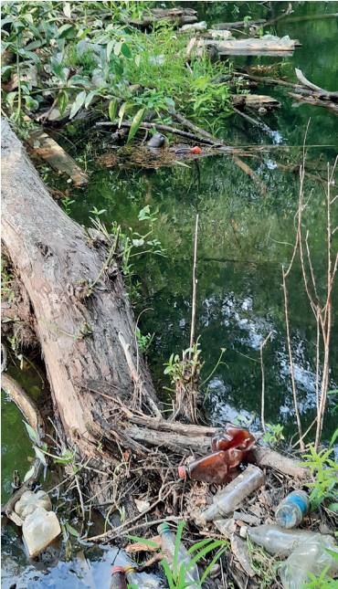
Так выглядят местами Осколец

На базе Центра эколого-биологического образования был создан летний экологический отряд,