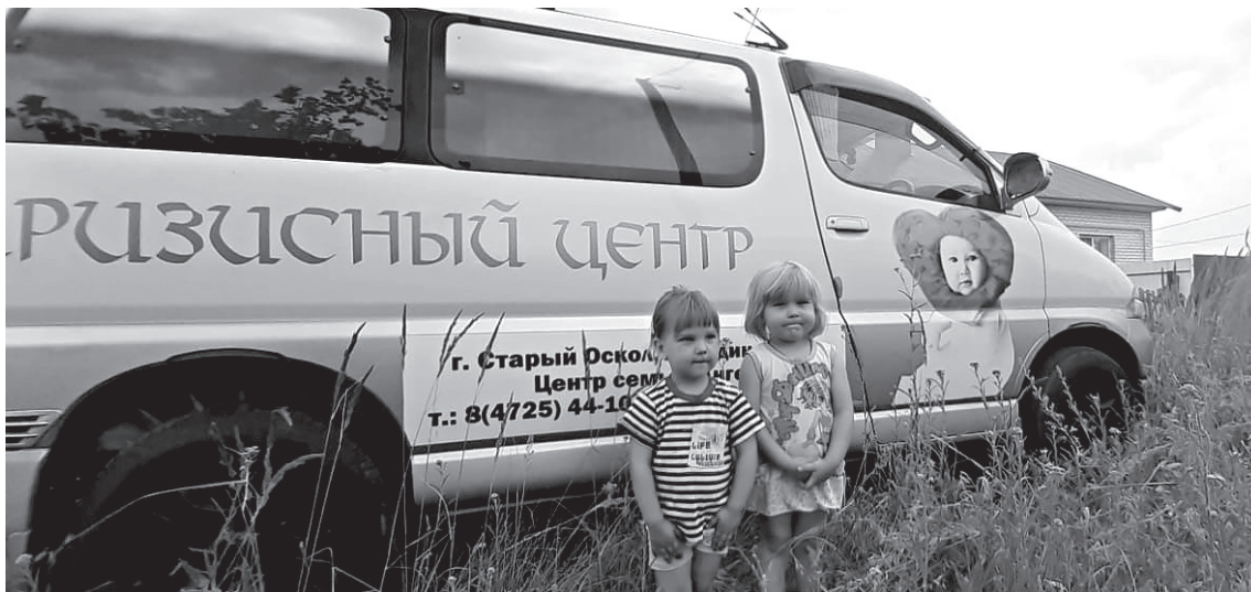
■ Продукты и необходимые вещи привезут домой

– В работе с женщинами мы уделяем большое внимание тем, кто решил прервать незапланированную беременность или от-