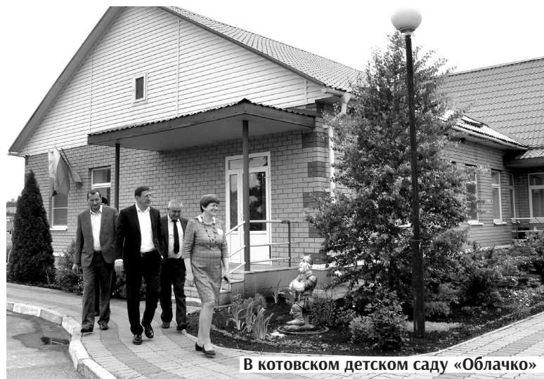
В котовском детском саду «Облачко»