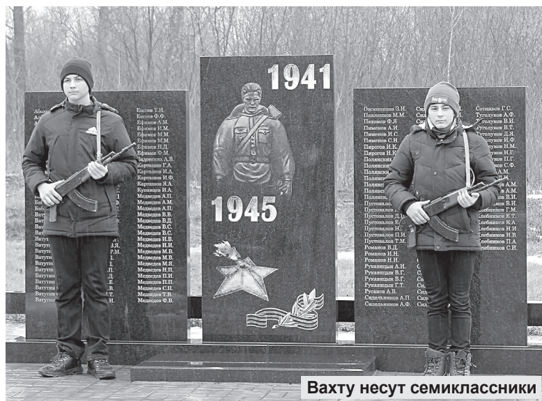
Вахту несут семиклассники