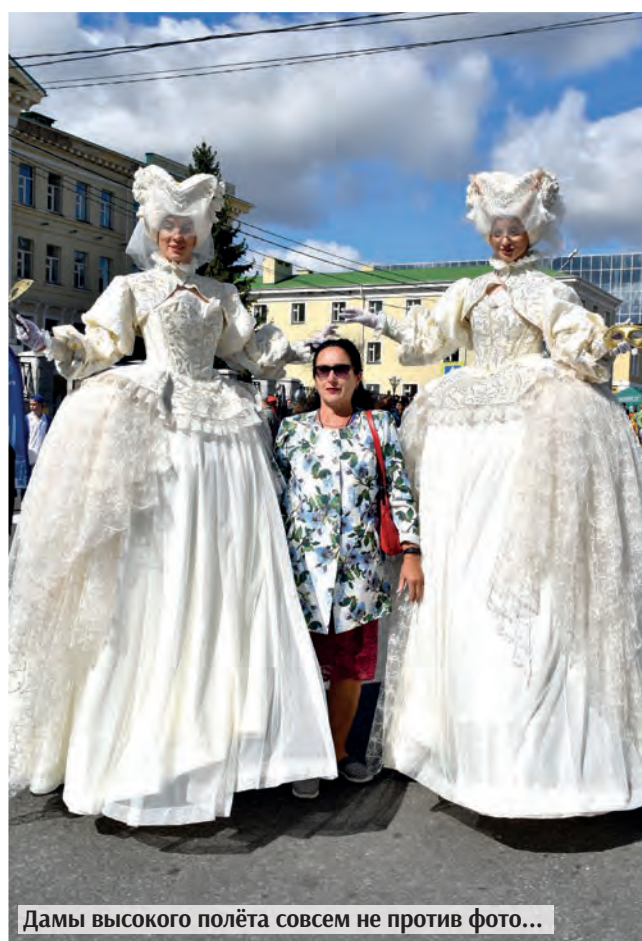
Дамы высокого полёта совсем не против фото...