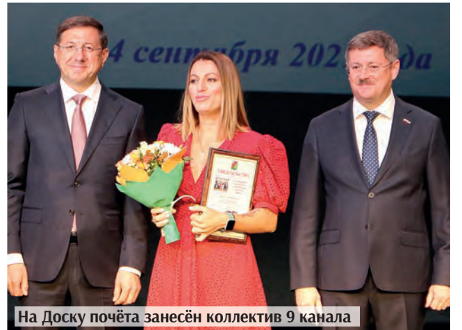
На Доску почета занесён коллектив 9 канала