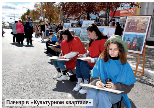
Пленэр в «Культурном квартале»