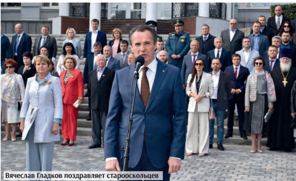
Вячеслав Гладков поздравляет старооскольцев