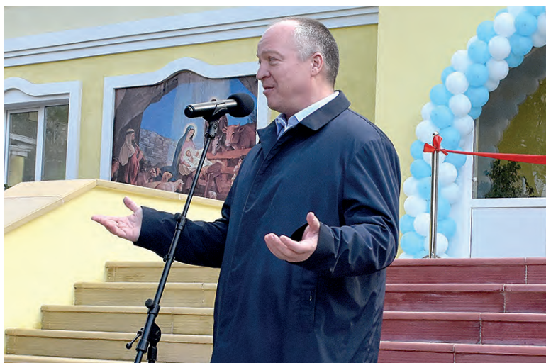
■ Андрей Скоч на церемонии открытия

Осмотрев здание «Введенского», Андрей Скоч поделился с