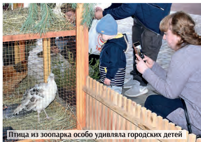
Птица из зоопарка особо удивляла городских детей

К концу года планируется полностью открыть физкультурно-оздоровительный комплекс, включающий в себя три бассейна, фитнес-залы. Уже сейчас работает большой зал для игровых видов спорта.