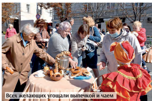
Всех желающих угощали выпечкой и чаем