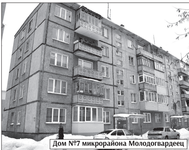
Дом №7 микрорайона Молодогвардеец