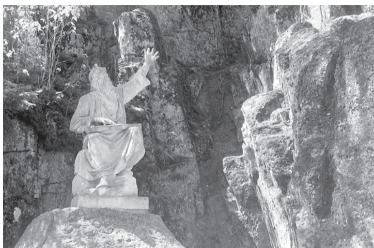
📍 В «Монрепо» статуя Вьянемейнена – героя эпоса Калевала. Современная копия работы скульптора И. Таканена 1873 года

В Выборге – более 300 различных памятников: архитектурных, исторических, скульптурных, археологических, садово-паркового искусства. Среди них – замок на воде XIII века, ратуша 1643 года постройки и другие замечательные места и сооружения, с которыми связано бесконечное множество исторических событий, преданий, легенд. И наш целый один день, проведённый в этом городе, – лишь беглый взгляд, анонс