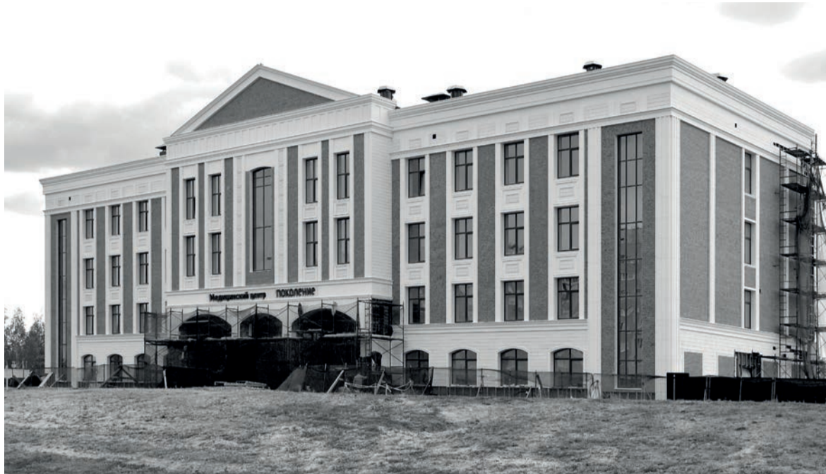
Здание медицинского центра, без сомнения, станет украшением Старого Оскола

В новом Центре будут принимать по 250–300 человек в день. Оперативный потенциал – 4500 вмешательств в год. Сформирована команда специалистов, которая будет здесь работать. Эти врачи хорошо себя зарекомендовали, стажировались за границей, в лучших российских институтах. Сейчас они работают в медцентре «Поколение», который появился в нашем округе в 2015 году. Это был первый в области частный хирургический стационар на 15 коек. С тех пор там выполнено более 4500 малоинвазивных оперативных вмешательств, из них около 45 % амбулаторно. 1188 пациентов (34 %) прооперировано