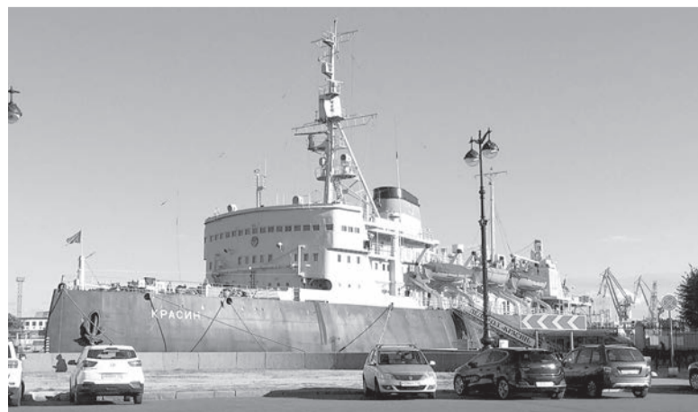
📍 Знаменитый «Красин»

Это место сейчас есть во многих туристических путеводителях. В связи с модернизацией производства часть территории завода