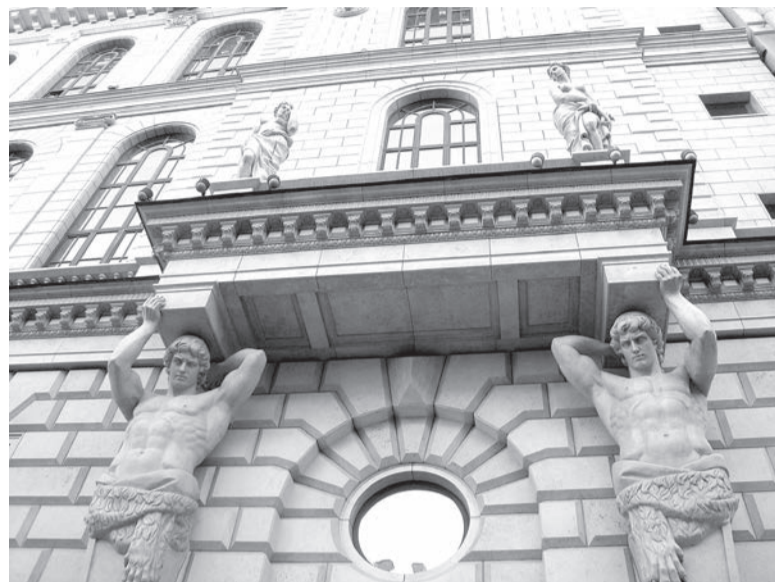
📍 Здание Газпромбанка

Линий метро в Питере намного меньше, чем в Москве, но в дополнение – множество автобусов, троллейбусов, маршруток. Всё это транспортное разнообразие не спасло, когда мы решили посетить современное популярное арт-пространство под название «Севкабель порт». Изучив местность по карте, мы, как настоящие туристы, отправились туда пешком, дабы по пути осматривать всё, чем богат Васильевский остров. Силы окончательно нас покинули, когда вместо «Севкабеля» мы вышли к теплоходу-музею «Красин» и горному институту на