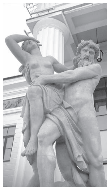
📍 Горный институт

«Севкабель» на набережной Финского залива оказалась не востребованной и была преобразована в одно из новомодных пространств. Здесь большой фуд-корт, детская площадка, разные арт-объекты, украшающие пейзаж. Можно было посидеть на набережной, но разыгрался знаменитый питерский ветер, который, как говорят, дует не на север или юг, а всегда в лицо. Из культурных событий в тот день там проходила выставка современных художников – последователей Энди Уорхолла. Почему-то стало жалко отдавать за вход 800 рублей, и мы решили отправиться по ещё одному адресу из путеводителей – в кафе при студии документальных фильмов «Лендок», а через некоторое время оттуда – ближе к дому, на ставший родным Невский. Проспект встретил музыкой и песнями. Прямо у Дома Зингера расположился вокально-инструментальный ансамбль. Всё было по-настоящему: