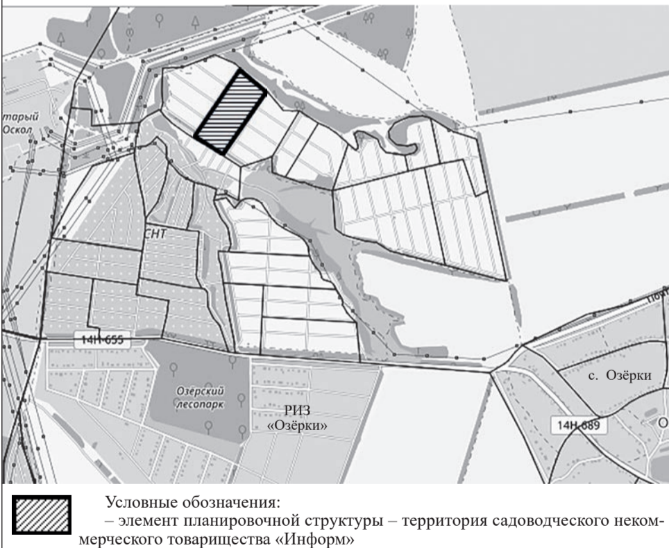
Схема местоположения элемента планировочной структуры территории садоводческого некоммерческого товарищества «Информ», расположенного в границах Старооскольского городского округа Белгородской области

Российская Федерация Белгородская область Старооскольский городской округ Администрация Старооскольского городского округа Белгородской области