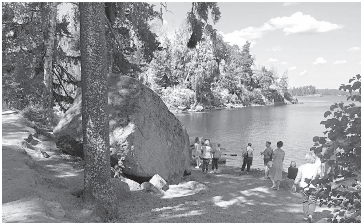
📍 В парке «Монрепо»

Этим летом мы впервые близко познакомились с Северной столицей