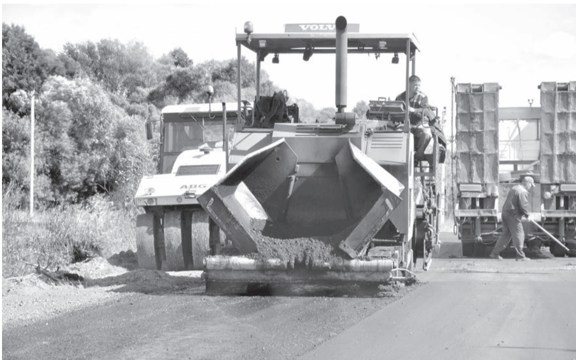
■ Работает современная техника

Мы напомнили молодым людям, что автодорога Старый Оскол – Долгая Поляна – Монаково включена в проект программы дорожных работ на 2022 год, чему они обрадовались.