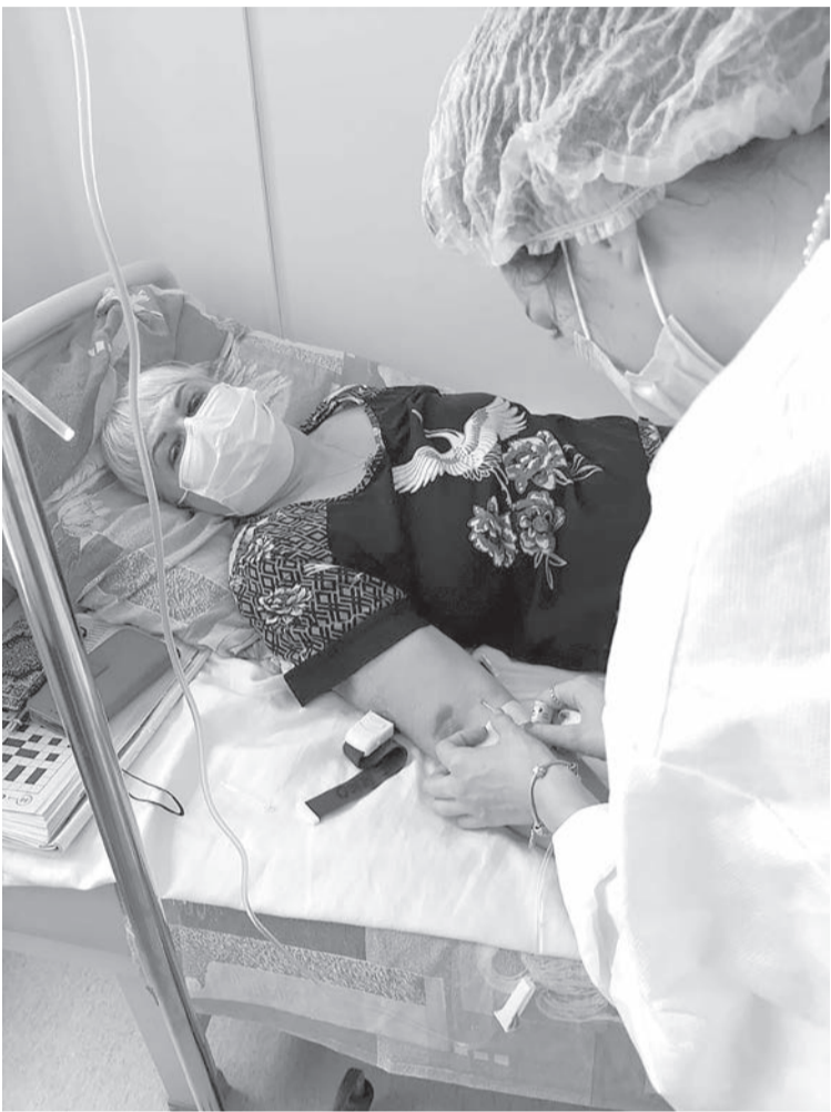
■ Автор на больничной койке

Из беседы с Кристиной Романовой, которая работает в ко-