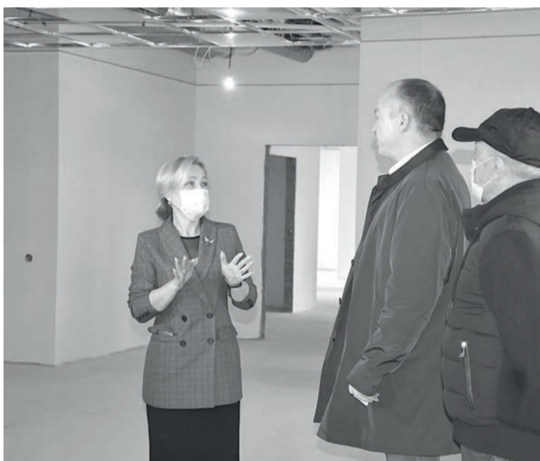
Максимум внимания ко всем деталям

бесплатно в рамках обязательного медицинского страхования.