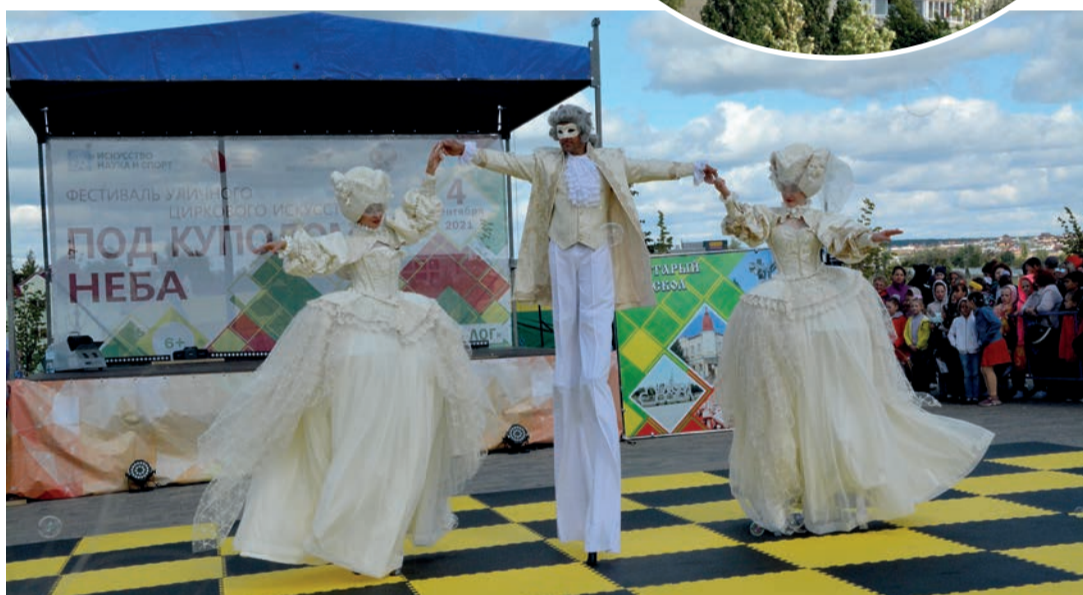
Шоу-балет «Невский квартал»

Своим мастерством удивили артисты на ходулях – участники воронежского шоу-балета