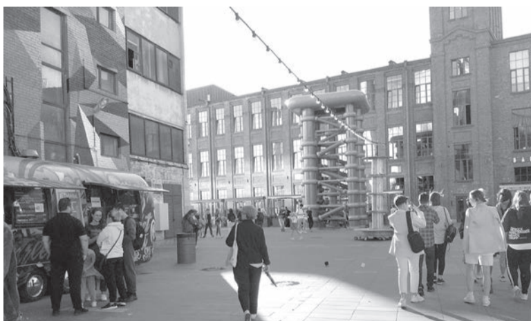
📍 Севкабель порт

клавишные, ударная установка, гитара, прекрасный вокал. И во-круг – поющая и танцующая толпа. Музыканты умудрились составить зажигательное попурри из песен прошлых лет – от хитов 80–90-х до «Катюши», и всё это вместе с ними исполняли многочисленные зрители, в основном зелёная молодёжь. И ведь очень многие знали слова! Нельзя было не примкнуть к дружному хору. То была прощальная песнь – на следующий день нам предстояло покинуть Санкт-Петербург, город, в котором мы успели увидеть так немного. Но мы обязательно вернёмся – не зря же побросали в Финский залив всю мелочь из карманов!