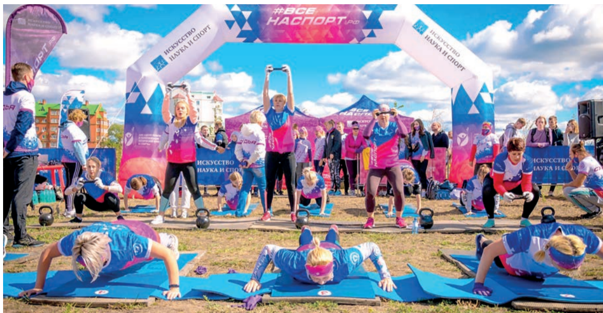
Участники турнира «Уличная атлетика»

Одним из главных событий Дня города стал фестиваль #ВСЕНАСПОРТрф