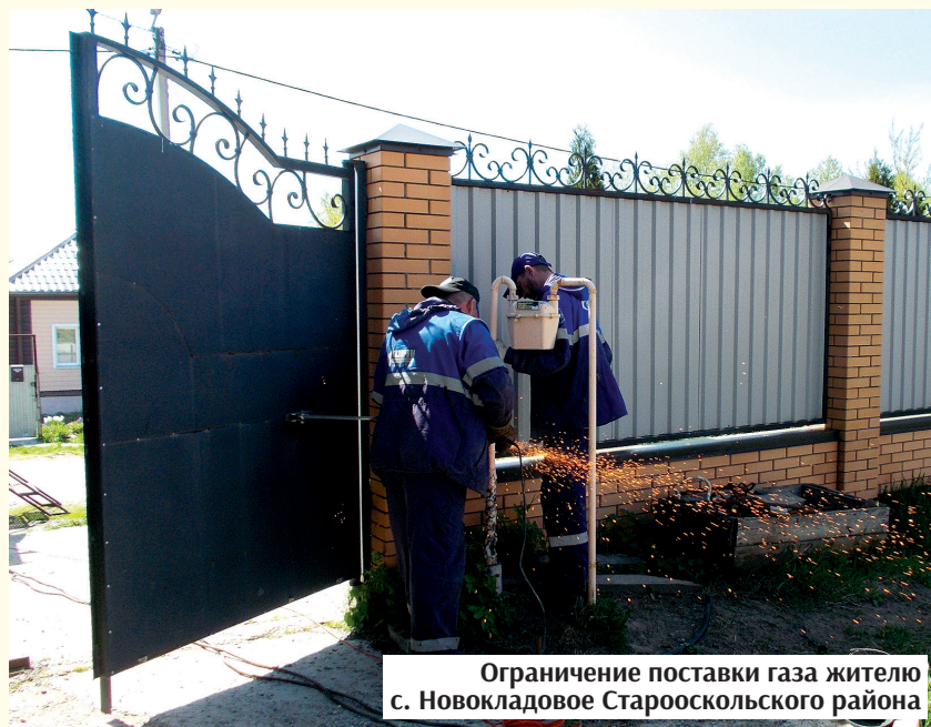
Ограничение поставки газа жителю с. Новокладовое Старооскольского района

В случае выявления факта самовольного подключения газа абоненту будет произведён перерасчёт начислений по нормативам потребления газа с применением повышающего коэффициента «10». Наряду с этим в правоохранительные органы будет направлено заявление о привлечении нарушителя к уголовной ответственности.