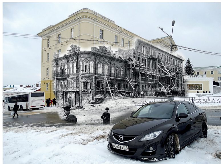
Реконструкция дома купца Соломенцова, сейчас здание ГРТ