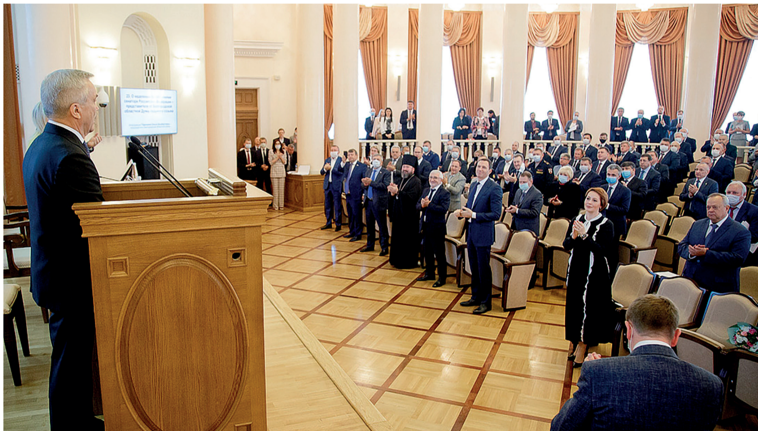
После выступления Евгения Савченко зал аплодировал стоя

Евгений Савченко назначен сенатором от Белгородской области. Провожали его долгими аплодисментами