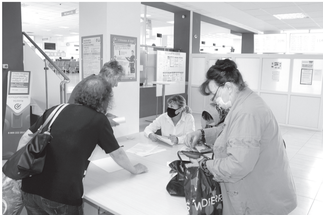
Льготники в МФЦ