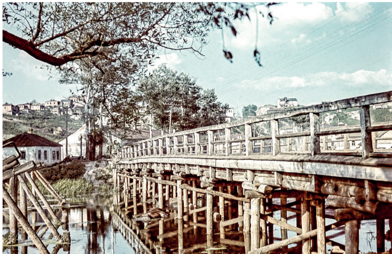
Гуменский мост.

Читайте новости первыми на сайте www.oskol-kray.ru и в наших группах в соцсетях