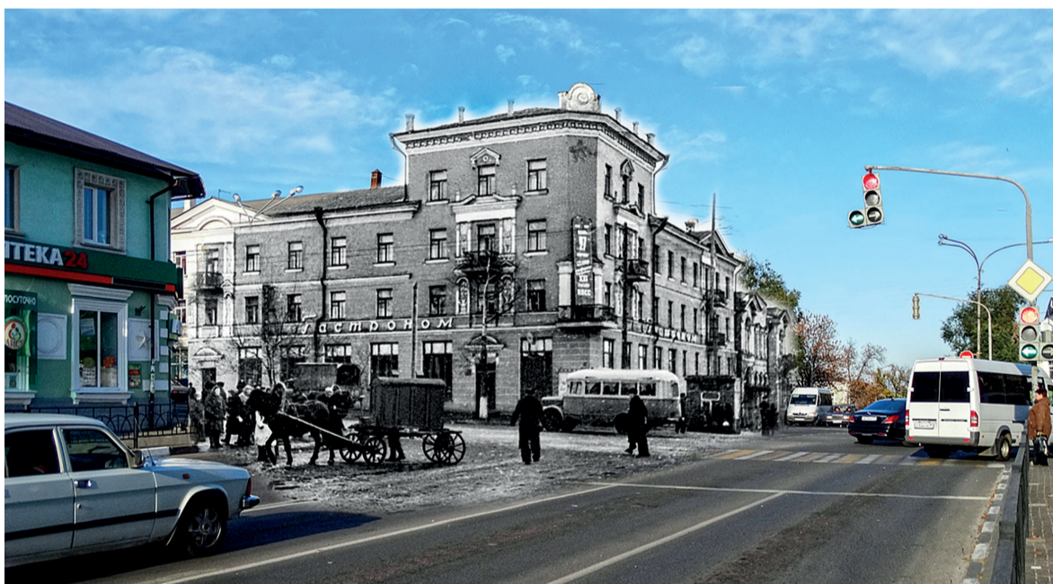
Перекрёсток улиц Ленина и Комсомольской. В 1958 году на повозке сюда привозили свежий хлеб

Каждая работа серии «Окно в прошлое» соединяет по два снимка – современный и архивный, сделанный в 50-х, 70-х годах прошлого столетия и даже более века назад. Зритель видит знакомую ему улицу, но она ведёт его в далёкое прошлое. Он словно попадает в параллельное пространство, где вокруг возникают исчезнувшие много лет назад храмы и колокольни, где с привычного путепровода можно «сойти» на мощёную булыжником мостовую, а из-под современных фасадов появляется искусная кирпичная кладка вековой давности.