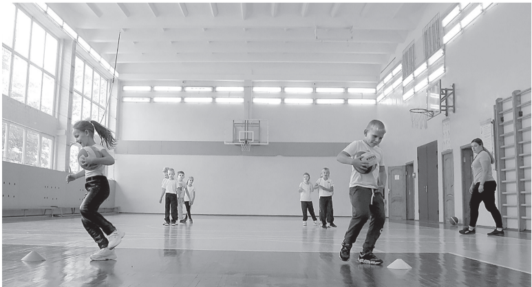
Обновлённый спортивный зал

В течение двух недель все работы были выполнены: снят старый слой штукатурки и уложен свежий, нанесено покрытие.