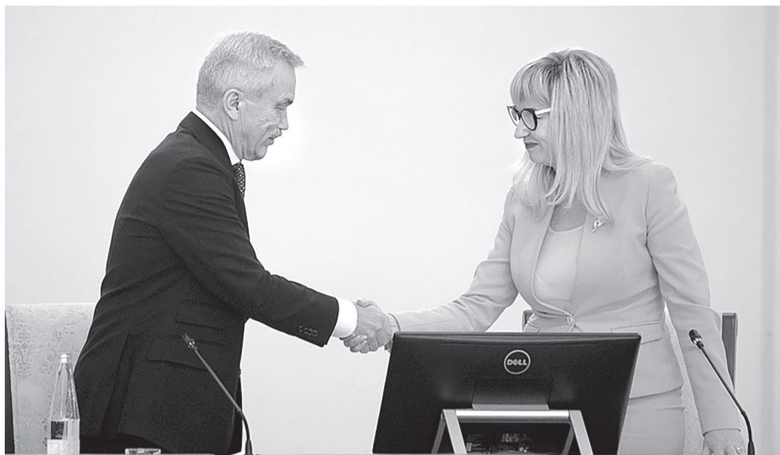
Евгения Савченко благодарит нового спикера облдумы Ольгу Павлову

Правительство Белгородской области, Белгородская областная дума