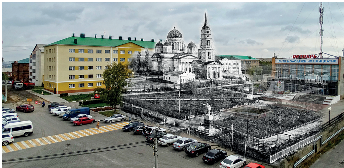
Богоявленский собор и Пионерский парк