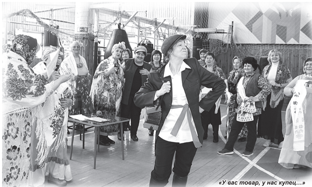
«У вас товар, у нас купец...»

СЦЕНКУ «Сватовство на Масленицу» мастерицы разыграли участницы школы деловой активности «Надежда» на празднике «Ай да Масленица!», который состоялся 15 февраля в ФОКе «Молодость».