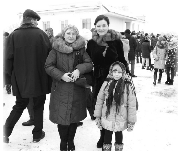
Фото с депутатом на память.