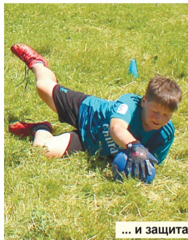
... и защита