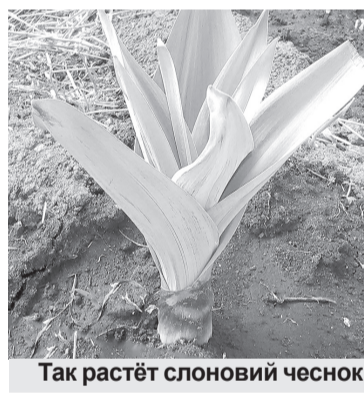
Так растёт слоновий чеснок

Этот «авантюрист» изменит представление о привычных нам вкусах, он придаёт особый аромат салатам, супам и вторым блюдам. Для применения в пищу пригодны молодые листья и стрелки рокамболя. Их можно жарить – вкус схож с грибами, или мариновать – получим вкус каперсов.