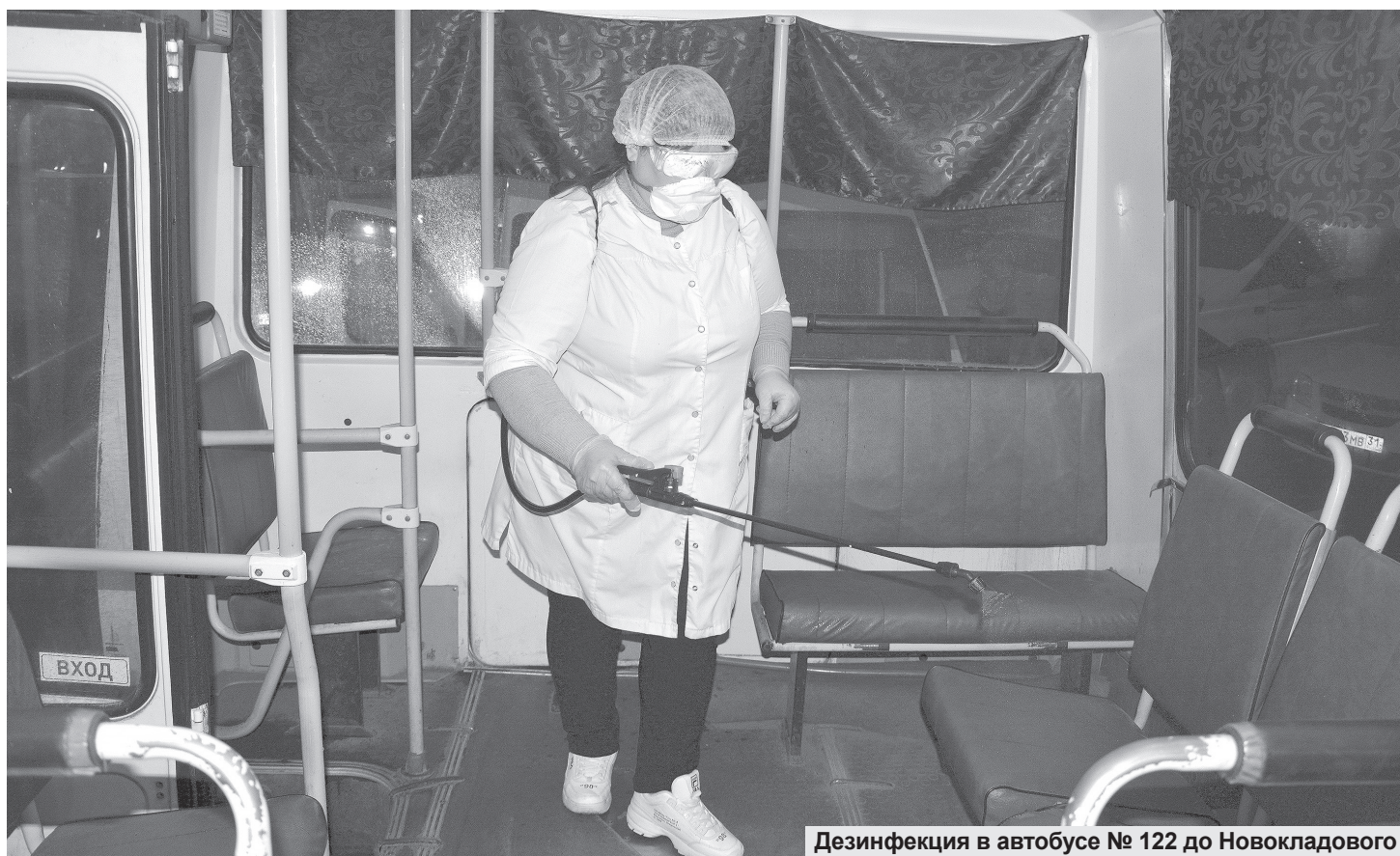
Дезинфекция в автобусе № 122 до Новокладового