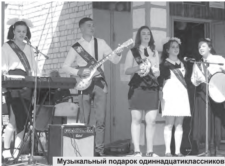
Музыкальный подарок одиннадцатиклассников