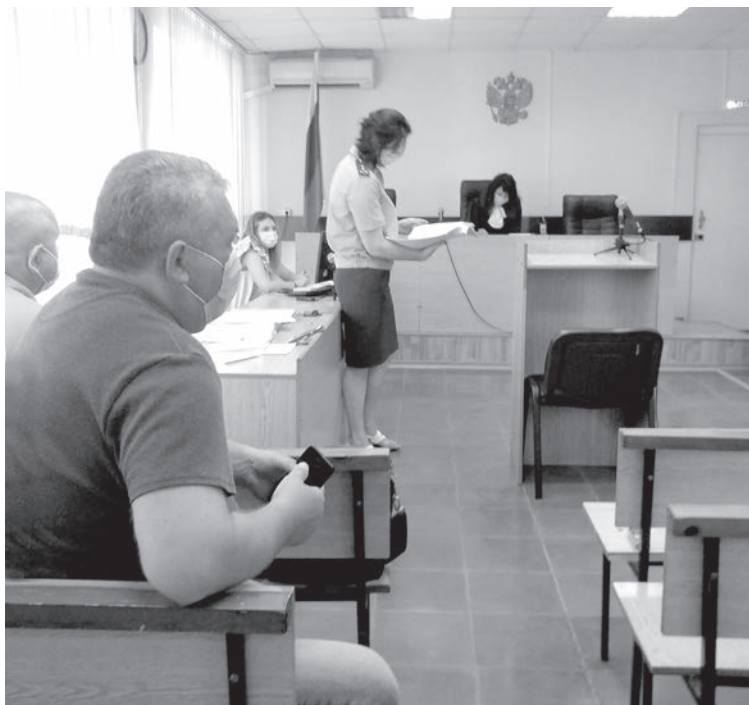
Идёт суд

Парочка грабителей обчищала магазины, долго оставаясь безнаказанной