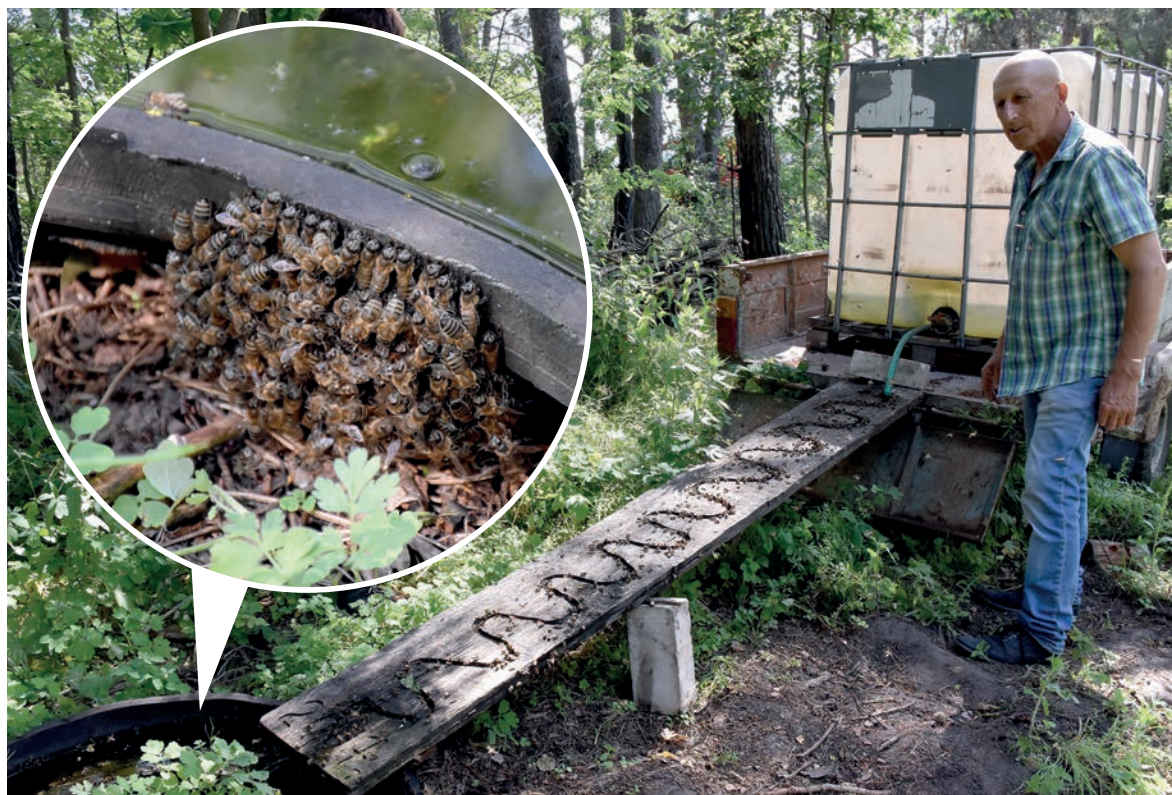
Змейкой вьётся жёлоб поилки для пчёл. А вот и новая семья!

... Пришла пора прощаться. Перед отъездом у поилки полосатых тружениц мы заметили маленький рой. На наших глазах зарождалась новая ячейка пчелиного общества, а значит, мёду быть!