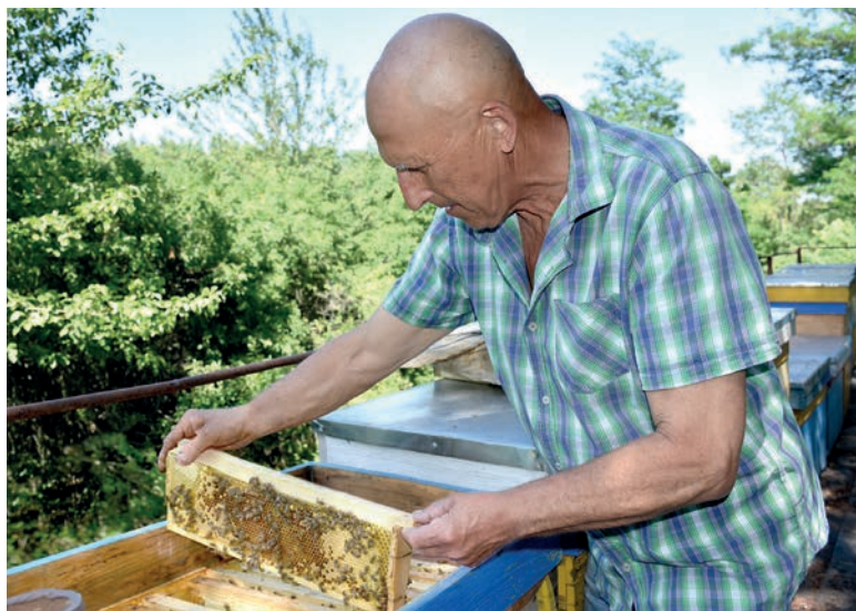
Опытному пчеловоду дымарь не нужен

– Много одеколона нравится, наверное, только женщинам во Франции. Пчёлам это точно не по