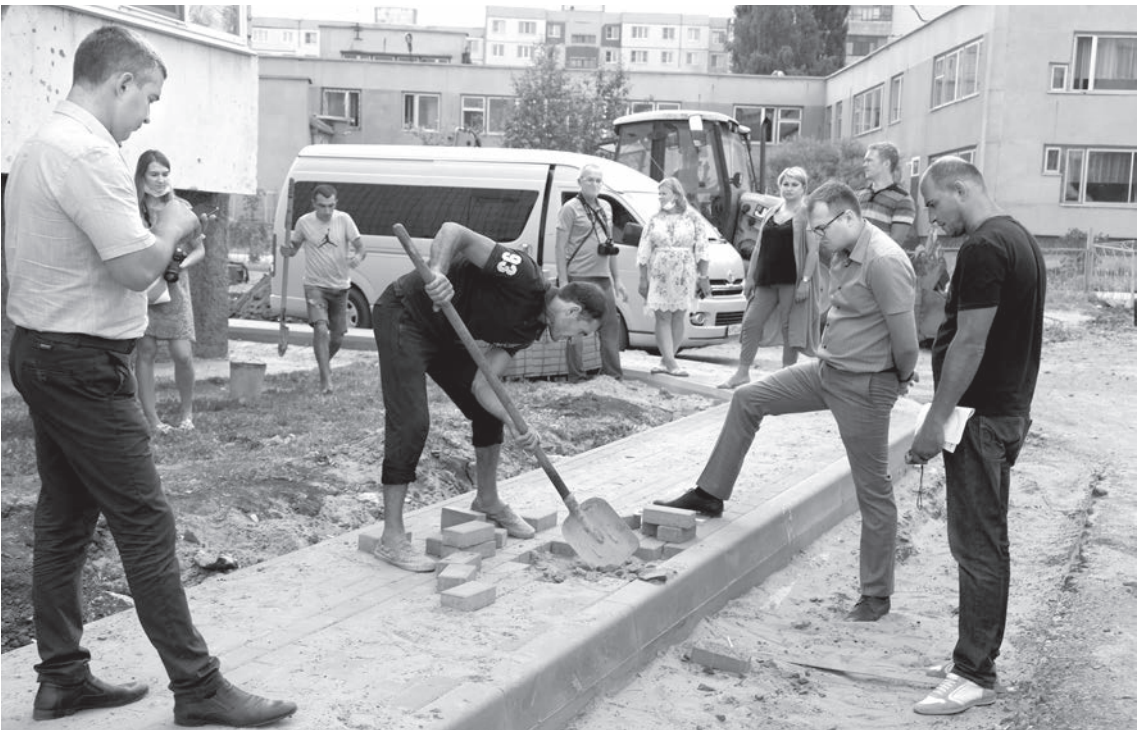
📷 Проверка качества работ у дома № 12 в микрорайоне Весенний